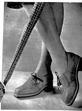
Hübscher Sportfrotteur in schöner Passform und modernem Sellenverschluss