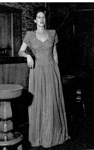
Olivengrünes Abendkleid; Oberteil aus St. Galler Spitzen, Unterteil aus leichtem Tüll