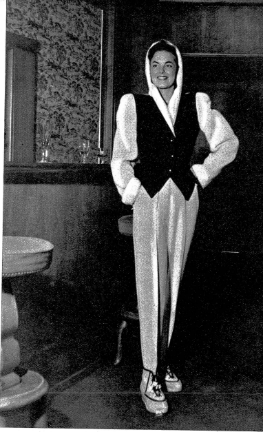
Skikleid, weiss mit grünem Gürtel, dazu passende Après-Skischuhe aus Naturkalbsleder