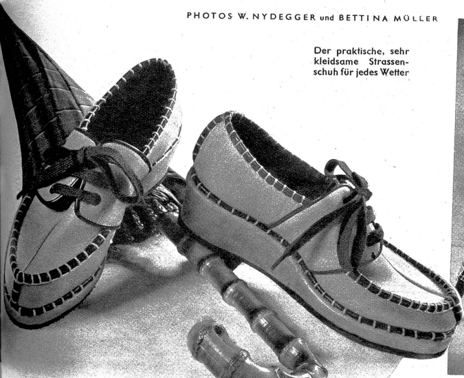
Der praktische, sehr kleidsame Strassenschuh für jedes Wetter