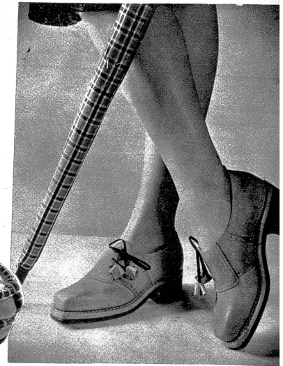
Hübscher Sporttrotteur in schöner Passform und modernem Seifenverschluss

Die Schuhkollektion der Firma Kornfein zeigte durchwegs einen besonderen Stil, und die Modelle wirkten durch ihre aparte Form und ihr sehr schönes Material und rundeten das Gesamtbild der Modevorführung harmonisch ab. Der erhöhte Laufsteg im Kursaal ermöglichte eine bessere Uebersicht der Schuhmodelle, man konnte sie wirklich näher beobachten, prüfen und — bewundern. Zu den Skikostümen wurden schöne Sportmodelle vorgeführt, von denen ganz besonders die Après-Ski in ihrer besonderen Form und Machart eine sehr gute Note aufwiesen. Der Trotteur behauptete seine ausgezeichnete Position und wirkte in seiner eleganten Form, trotz des soliden Eindrucks, nicht schwer und plump. Die bizarre Extravaganz schimmerte oft bei einigen Modellen zum eleganten Nachmittagskleid durch. Die kokette Form und das verarbeitete Material fanden offene Anerkennung und lebhaftes Interesse.