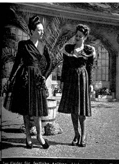
Zwei Kleider für festliche Anlässe: Links, schwarzer Tüll mit Taschen und Stoffblättern. Rechts, ein braunes Moiré-Tüll-Kleid mit grossem Kragen und Spitzen in Helltürkis