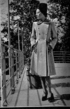
Beige-Mantel mit brauner Applikation am Kragen und an den Taschen