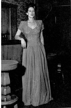
Berggrünes Abendkleid: Oberteil aus St. Galler Spitzen, Unterteil aus leichtem Tüll