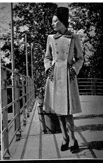
Beige-Mantel mit brauner Applikation am Kragen und an den Taschen