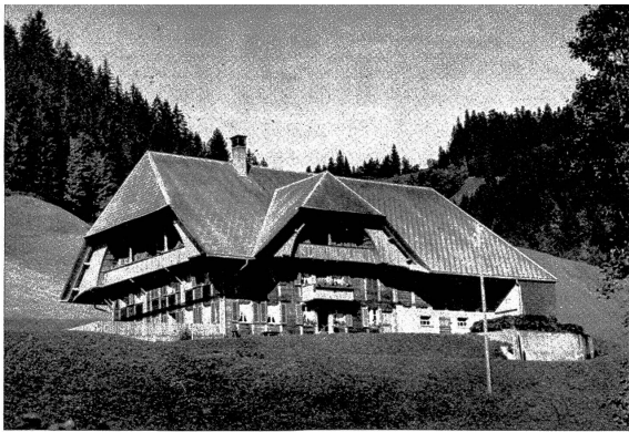
Die „Sunnhalde“, ein behäbiges Emmentaler Bauernhaus mit typisch breitem Dach, das für drei Wochen für mich zur prachtvollen Heimat wurde

Wer nach dem «Weshalb» fragt, dem sei gesagt: «Wenn ihr's nicht fühlt, ihr werdet's nicht erjagen.»