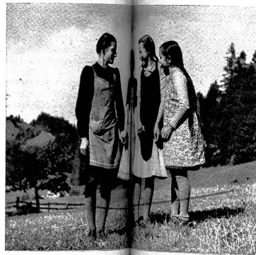
Die „Sunnhalde“, war ein Haus, in dem ich mich wohlfühlte. Sie waren im Haus, Feld und Stall gleichgültig, aber bei allem immer noch gut gelaunt. Ich habe gelegentlich gehört, dass sich manches Stadtfraulein an ihrem frischen Bauernwesen ein Beispiel nehmen