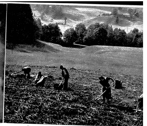
Die Arbeit auf dem Felde, zusammen mit dem Bauer und seiner Familie, war für mich ein ganz neues Erlebnis

im Leben des Bauern. Aber diese wenigen Stunden sind deshalb auch besonders teuer und wertvoll. Das laute Vergnügen hat wenig Platz mehr; es ist die gelöste Entspannung der Menschen, die ein schweres Tagwerk vollbracht haben. Am Sonntagmittag holte wohl der Meisterknecht sein Handörgel hervor und spielte im Hof ein paar flotte Ländler. Mit ihm stand ich übrigens per Du, nachdem wir einmal zwei Schweine zusammen übrigen mussten, die durch meine Unachtsamkeit den Weg in die Freiheit gefunden hatten. Da wir also im besten Sinne des Wortes «zusammen Schweine gehütet hatten», liessen wir die färmliche Anrede fallen. Wenn ich ihn so Tag für Tag schwer und sicher arbeiten sah, will mir dieser Vertrauensbeweis wie eine schöne Auszeichnung vorkommen.