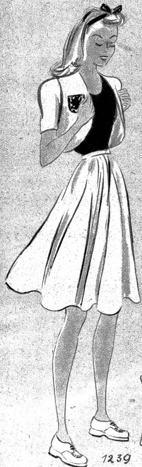
1239: Bolero und Jupe — wie geschaffen für den Backfisch! Ein kleines Wappen dient als Garnitur auf dem Bolero