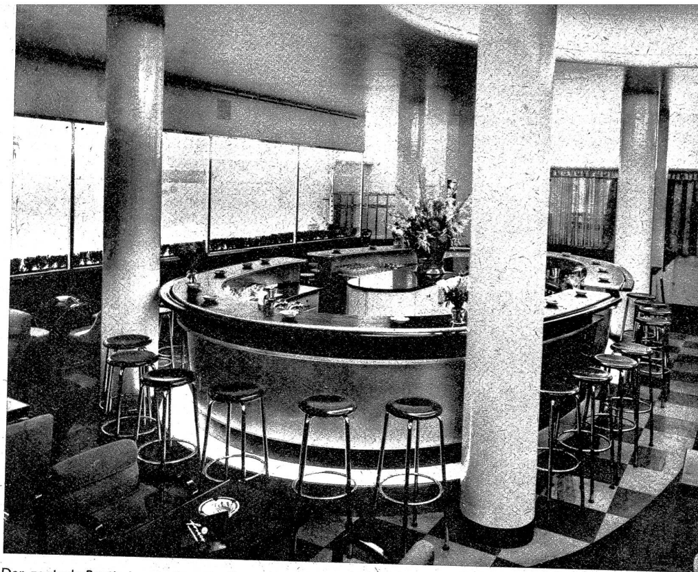
Der zentrale Bartisch, von dem aus auch die Nischen und die übrigen Sitzplätze gut bedient werden können

Was die modernen Hotels für sich beanspruchen, soll sich eine moderne Stadt für den Fremdenverkehr zu- nutze machen. Die umgebaute Frisco-Bar ist gewiss ein neuer An- ziehungspunkt für Gäste unserer Stadt, wobei der Glanz, der sie um- gibt, nur die Form bedeutet, und das Licht, in dem sie erscheint, soll auf gepflegte Betriebsführung hin- weisen, die dem Unternehmen zum guten Erfolg verhelfen wird.