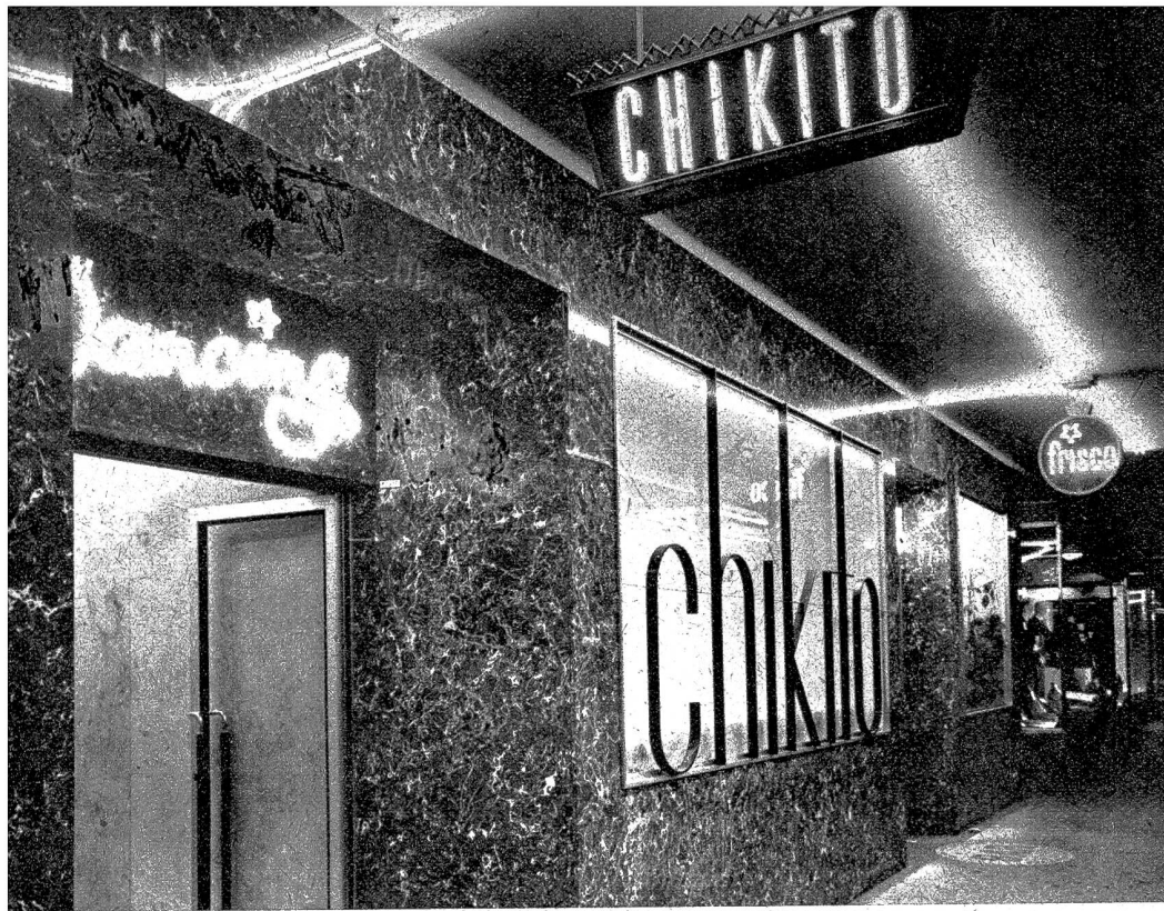
Aussenansicht der umgebauten Gaststätte

Die Frisco-Bar an der Neuengasse neben dem Eingang zum Dancing Chikito, ist von Grund auf neu gestaltet worden. Die neuartige Raumverteilung, der Innenausbau, die Beleuchtung und die geschmackvolle Einrichtung des Lokals verleihen der Bar das Gepräge einer besonderen Gaststätte.