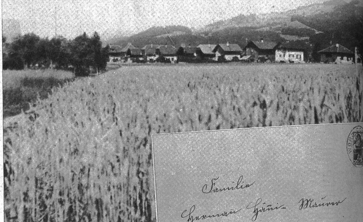
Das Berner Kalifornien liegt in einer fruchtbaren Landschaft, am Eingang zum Oberland. Es ist — verglichen mit dem Kalifornien in Amerika — ein wahres Eldorado