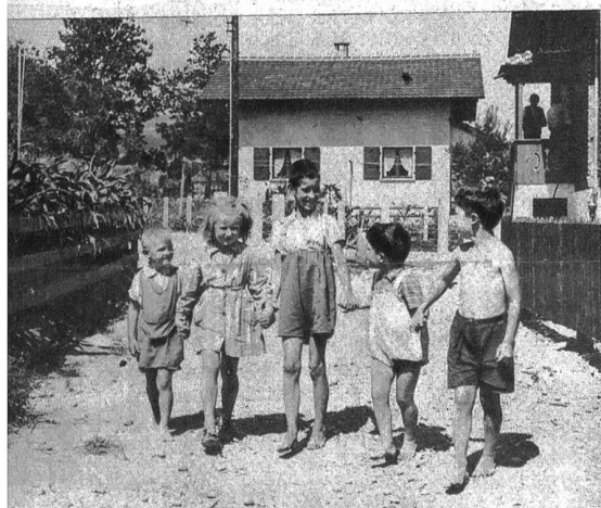
Gesunde, lustige kalifornische Kinder bringen Leben in das Dörfchen

Kalifornien, das «Schlaraffenland» Amerikas, wo der Ueberfluss des Reichtums auf den Strassen fließen soll und der unbesorgte Bewohner «von der Hand ins Maul» lebt ohne sich um den nächsten Tag kümmern zu müssen, hatte vor dem Kriege viele Schweizer — darunter zahlreiche Berner — übers Wasser gelockt.