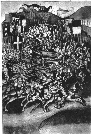
Höhepunkt der Laupenschlacht

„Ja, wahrscheinlich, wir haben ungefähr ein Dutzend. Sie sind schwer auseinanderzuhalten.“