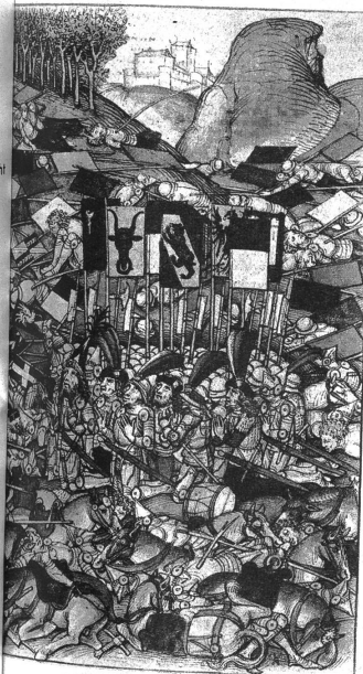
Höhepunkt der Laupenschlacht

Ein flüchtiges Lächeln lockert seine Mundwinkel, als das Tierchen, von Ariel zu Boden gesetzt, auf ihn zuspringt und an seinen weissen Leinenschuhen zu lecken beginnt, vielleicht in der Hoffnung, es sei Milch.