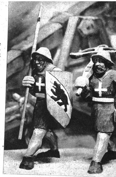
Zwei wackere Kriegerknechte der bernischen Streitmacht

Reportage: ILLUSTRATION