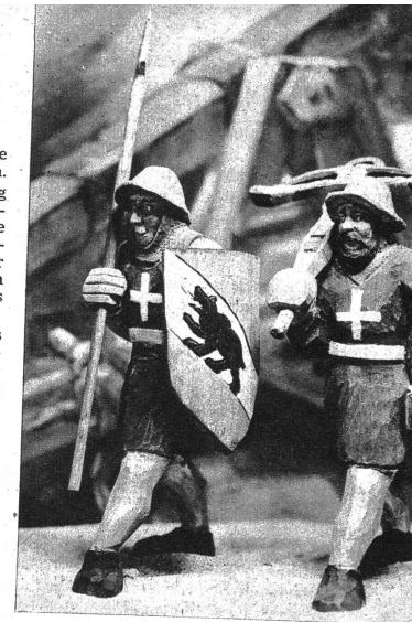
Zwei wackere Kriegersknechte der bernischen Streitmacht

Reportage: ILLUSTRA Fotos: Hans Steiner, Bern