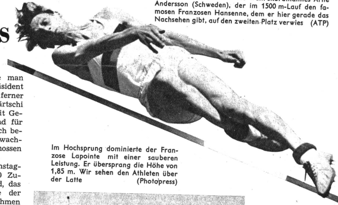
Im Hochsprung dominierte der Franzose Lapointe mit einer sauberen Leistung. Er übersprang die Höhe von 1,85 m. Wir sehen den Athleten über der Latte

Am Sonntagnachmittag fand als Abschluss ein internationales Leichtathletiktreffen zwischen den Besten aus Schweden, Belgien, Frankreich, Italien und der Schweiz, trotz dem wiederum Tausende von begeisterten Zuschauern, statt. Hier musste man aber Disziplinen noch etliches zuzulernen haben, bis sie mit wirklich erstklassigen Leistungen aufwarten können und an die Klasse der weltbesten Schweden heranreichen können.