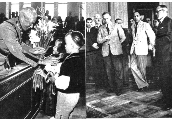
Während dem Festakt zur Feier des 50jährigen Bestehens des SFAV im Grossratssaal des Rathauses zu Bern werden General Guisan von einem kleinen Pärchen in Berner Tracht Blumen überreicht