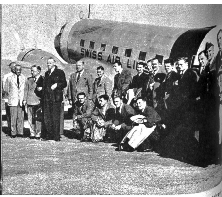
Die englischen Fussballspieler, die ein Länderspiel gegen die schweizerische Nationalmannschaft auszutragen hatten, langten am Freitagabend mit einer Douglasmaschine der Swissair auf dem Flughafen Dübendorf an. Das gleiche Flugzeug brachte auch unseren Gesandten in London, Minister Paul Rüegger (rechts)