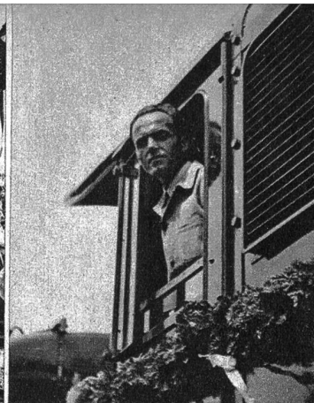
Der Lokomotivführer, der den ersten elektrisch betriebenen Zug führte