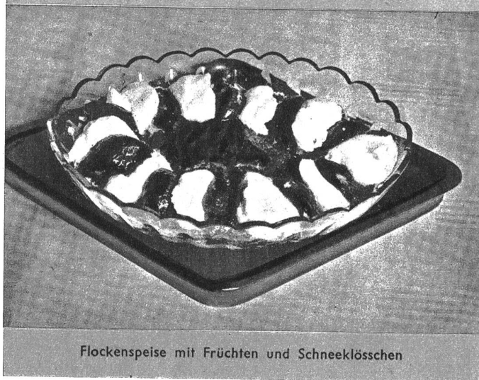
Flockenspeise mit Früchten und Schneeklösschen

Flockenspeise. In eine Glasschüssel gibt man gesüßtes Fruchtmarm lagenweise mit Weizenflocken (Cornflakes oder Matzingerflocken gehen auch) und verziert zum Schluss mit ganzen Früchten und geschlagenem Eiweiss mit Zucker vermischt.