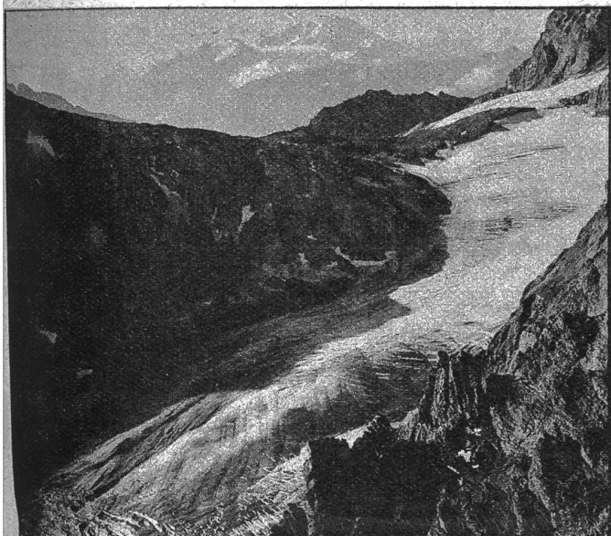
Am Lötschenpass bei Kandersteg Zens. 1709.

tische Erkenntnisse aus der Handschrift. Unter Vermeidung lehrhafter Theorie und Systematik wird anhand vieler Schriftproben gezeigt, wie sich eine Anzahl im menschlichen Verkehr bedeutungsvolle Eigenschaften in der Handschrift äussern. In klaren, kurzen Zusammenfassungen werden nach erläuternder Besprechung alle wichtigen Merkmale für das grundlegende Erkennen von Ausdauer, Verträglichkeit, Geselligkeit, Temperament, Energie, Intelligenz und Unaufrichtigkeit zu einem praktischen Schlüssel geformt. Es ist wohl die einzige für den Laien verfasste graphologische Schrift, die in so einfacher Weise absolut Brauchbares ohne jeden Verstoß gegen die Wissenschaft bietet.