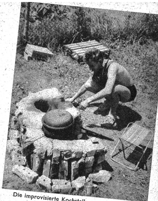
Die improvisierte Kochstelle aus Backsteinen zusammengestellt