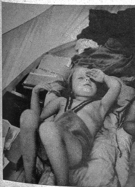
Ein Schläflchen im Zelt

Unten: Das Mittagessen in der freien Luft dürfte alt und jung besonders gut munden