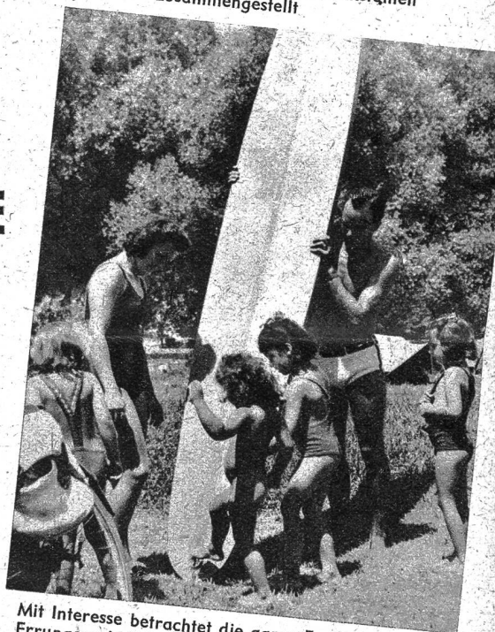
Mit Interesse betrachtet die ganze Familie die neue Errungenschaft, das Hawaiboot, mit dem man auf den Wellen der Aare reiten kann

Unten: Das Mittagessen in der freien Luft dürfte alt und jung besonders gut munden