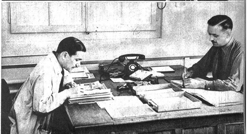
Oben rechts: Im Zeichnungsbüro erhalten die Ideen ihre erste konkrete Form