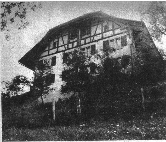
Der Landsitz Falkenhaus in Kehrsatz