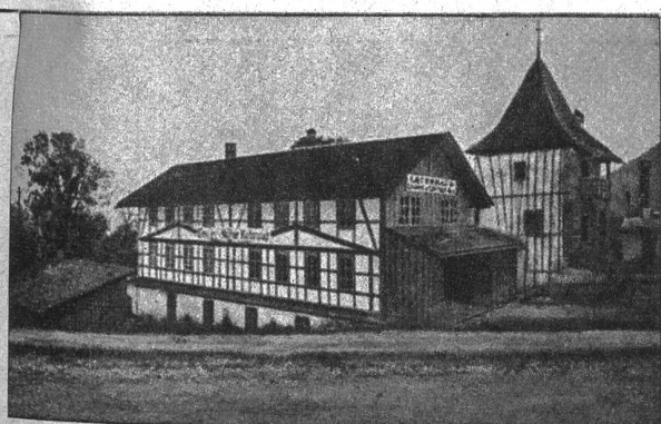
Die Gewürzmühle Kehrsatz

Merke: Jetzt ist auch noch gute Zeit zum Säen der Bohnen, der Gurken, Zuchetti, Cardy und der meisten andern Gemüsearten. Tomaten verpflanzen! G. Roth.