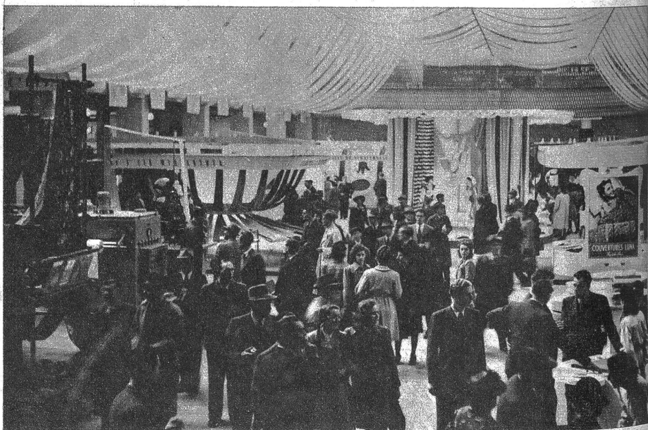
Textilien auf Export eingestellt. Die Schweizer Mustermesse 1945 spiegelt mehr noch als alle Vorgängerinnen den Drang des schweizerischen Schaffens, aus der geographisch bedingten Isolierung in wirtschaftlichen Belangen herauszuwachsen. So sind die Textilien mit Mode und Bekleidung in der Halle II der neuerdings erweiterten Messe, stark auf Export eingestellt, dem Streben unserer Industrien entsprechend

Zahlreiche Weinstuben und Restaurants sowie die Lebensmittelabteilung mit ihren Degustationen sorgen dafür, dass auch der Gaumen nicht zu kurz kommt und sich der ermüdete Beschauer immer wieder stärken kann. Und sogar für die besorgten Mütter ist gesorgt. Sie können sich diesmal ruhig einen gemütlichen Besuch der Mustermesse leisten, denn im Nestlé-Kinderparadies wird für die Kleinen bis zu 12 Jahren gesorgt, die dort von 9 bis 12 und 13 bis 18 Uhr ohne weitere Kosten abgegeben werden können, wo zahlreiche Vergnügungen und Beschäftigungen ihnen von geschultem Personal zur Unterhaltung geboten werden. hkr.