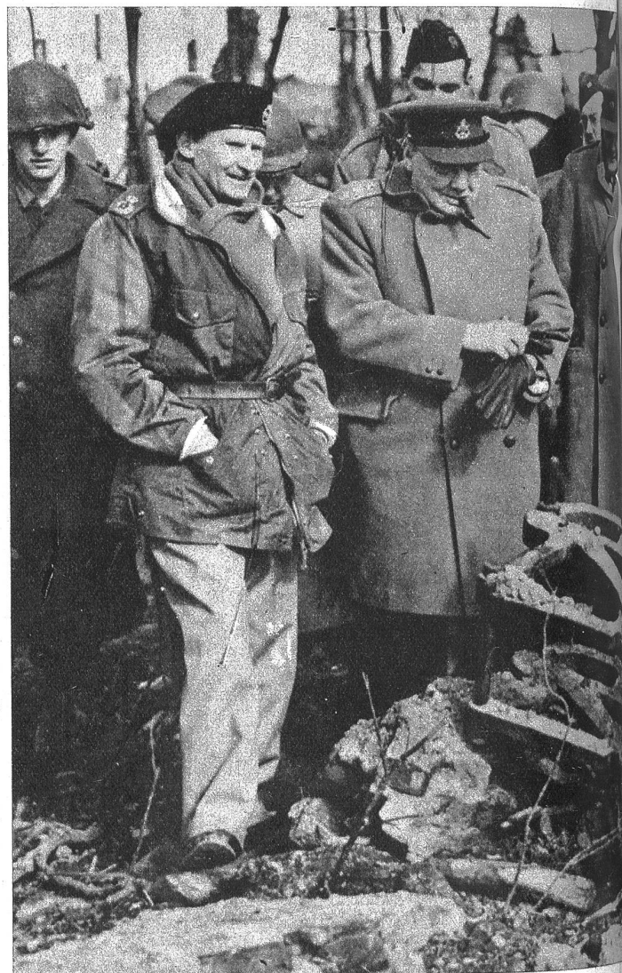
Feldmarschall Montgomery und Ministerpräsident Churchill im Kampfgebiet am Niederrhein