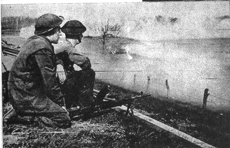
Ein britischer Maschinengewehrposten am Rhein, gedeckt durch die künstliche Nebelwand, bereit zum Feuerschutz für die über den Strom setzenden Einheiten