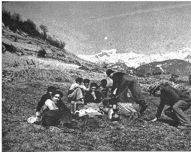
Das Mittagessen wird gemeinsam auf dem Rasen eingenommen