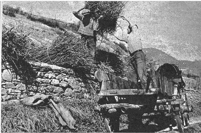
Eifrig wird die Arbeit angepackt