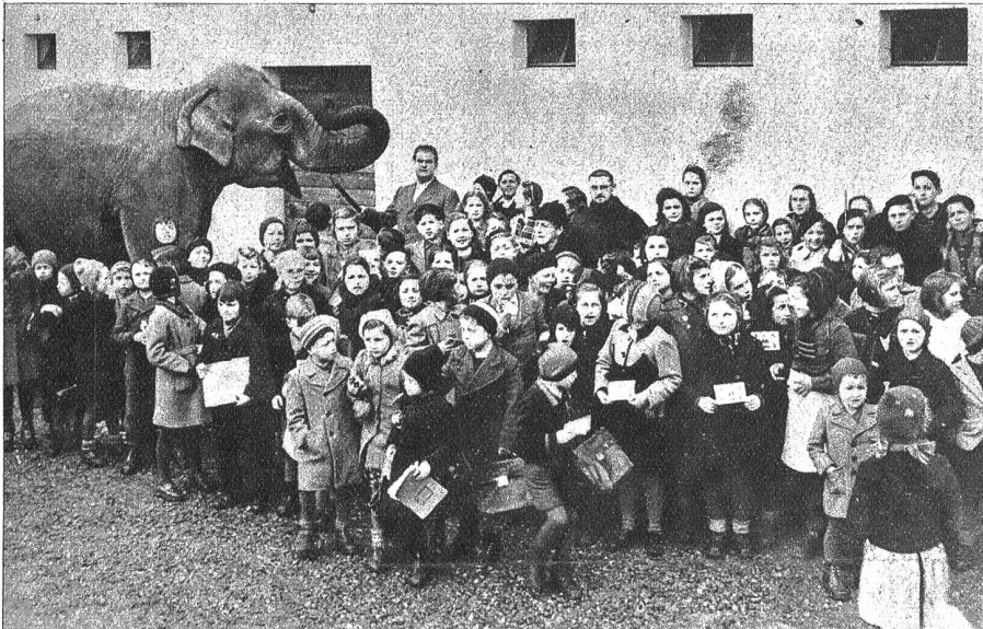
Franzosenkinder besuchen den Zirkus Knie in seinem Winterquartier