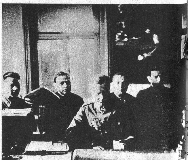
Generalfeldmarschall Paulus, der an Stelle von Manstein das Kommando zur Bezwingung Stalingrads übernahm, nach seiner Gefangennahme. Sein Dienstbüchlein, das er soeben, vielleicht das letzte Mal, durchblättert, muss abgegeben werden

Marschall Stalin schätzte die deutschen Verluste der gesamten Schlacht um Stalingrad auf 8 Millionen Mann, wovon Millionen Tote. Seit dieser denkwürdigen Schlacht marschieren die Russen unaufhaltsam vorwärts. Was ist wohl ihr Ziel?