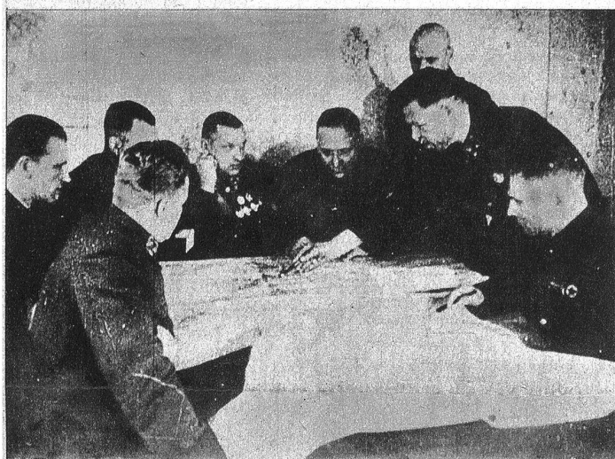
Im Hauptquartier von Stalingrad verwerteten die russischen Generale die Informationen, die ihnen der russische Geheimdienst sammelte

Das entscheidende Ereignis allergrösster Tragweite in diesem Weltkrieg, von dem von Militärsachverständigen behauptet wird, es habe zum Höhepunkt und zur Wendung des bis jetzt erlebten Kriegsgeschehens geführt, hat sich genau vor zwei Jahren abgespielt: Vor und in Stalingrad. Es ist kaum möglich, sich mit Worten oder Grössenvorstellungen über die Vernichtung sowie die Verteidigung von Stalingrad auszudrücken, mit wel-