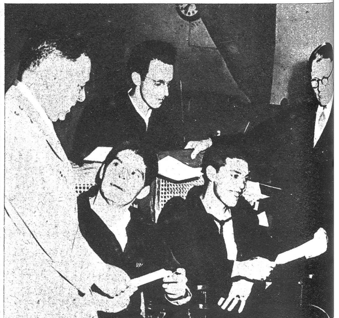
Nach Absolvierung einer Prüfung erhalten die Kriegsverletzten ein Diplom, das ihnen im Leben draussen als gute Referenz dienen soll

Dies zu verhüten, ihnen ihr Schicksal tragen zu helfen, und ihnen wieder vollwertige Menschen zu machen, zählt wohl zur humaneren Aufgabe eines kriegführenden Volkes. Amerika hat zu diesem Zwecke in Kalifornien eines der grössten Spitäler der Welt eröffnet, das nicht nur für die Heilung der Kriegsverletzten sorgt, sondern das ihnen sogar Gelegenheit bietet, freiwillig einen neuen Beruf zu erlernen, der ihnen, je nach ihrer Konstitution, im späteren Leben eine Existenzmöglichkeit bieten soll. Spital und Schule haben sich so zu einer Gemeinschaft zusammengefunden, die in grosszügiger Weise für Patienten sorgt und diese Aufgabe unentgeltlich erfüllt. «Birmingham General Hospital» in Kalifornien, das mehr als tausend Kriegsverletzte zu betreuen vermag, hat in moralischer Hinsicht für die Patienten sicher den richtigen Weg gewiesen. Möge der Geist dieser Institution und die Früchte ihrer Arbeit den vielen Kriegsverletzten helfen, ihr schweres Los leicht zu ertragen und einer gesicherten Zukunft entgegen zu gehen.