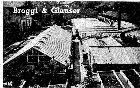
Gärtneri bei Volkshaus, Telefon 60130 Blumengeschäft im Hotel Bären, Telefon 60473

Zimmer mit fliessendem Wasser, Garagen, grössere und kleinere Säle, eigene Landwirtschaft