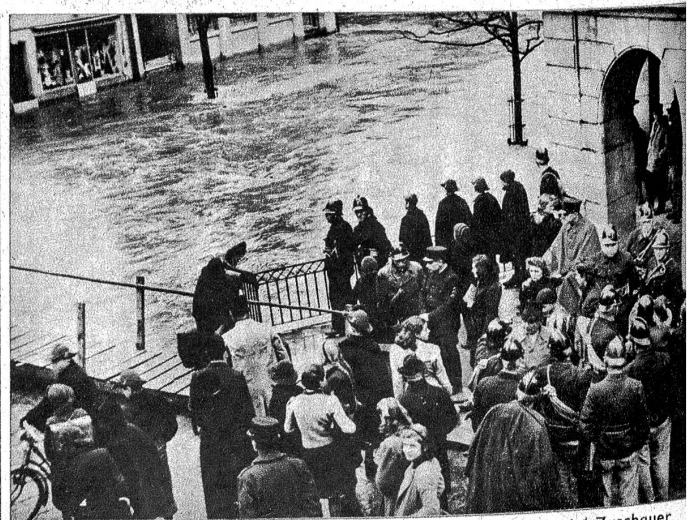
So eine Überschwemmung lockt natürlich immer viel Zuschauer herbei. Die Feuerwehr hat Hochbetrieb