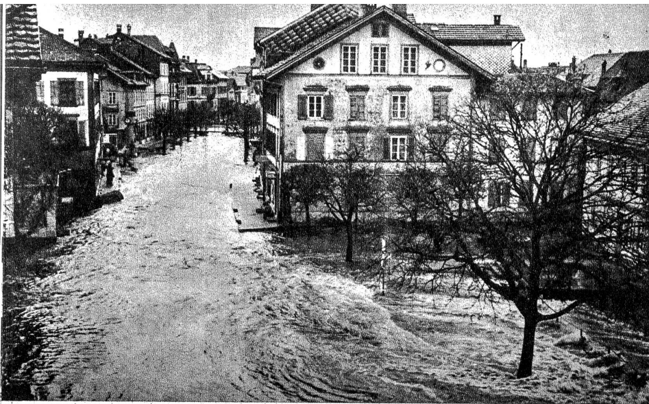
Ungestüm tritt der Bach hier aus seinem gewohnten Bett und überschwemmt die Strassen Langenthals