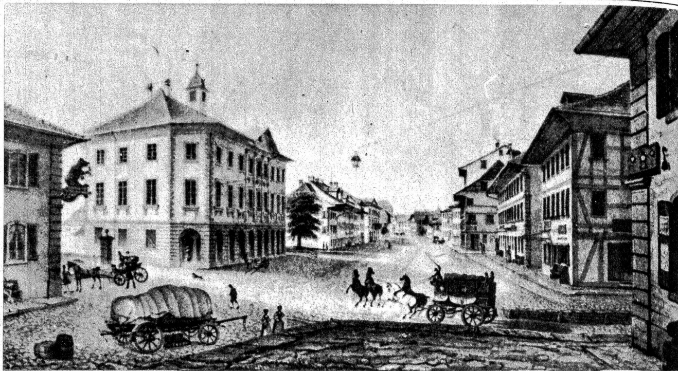
Langenthal ums Jahr 1830. Ankunft der Postkutsche