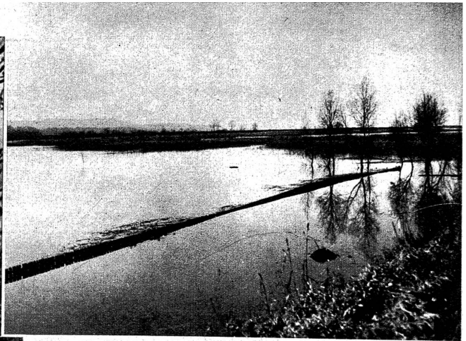
Wie tief das Wasser steht, sieht man am besten an diesem Zaun, der kaum noch sichtbar ist