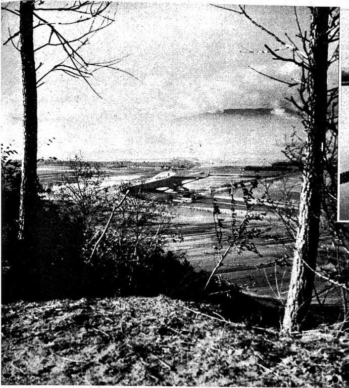
Ausblick vom Vuilly auf das überschwemmte Gebiet