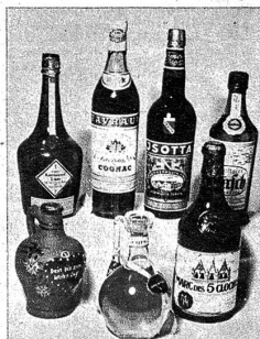
Drogerie Stauffer Bern, Schauplatzgasse 7