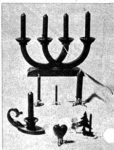
Drogerie Stauffer Bern, Schauplatzgasse 7