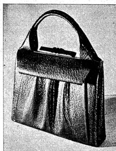
K. v. Hoven-Bern Kramgasse 45