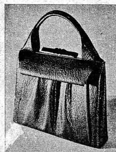
K. v. Hoven-Bern Kramgasse 45