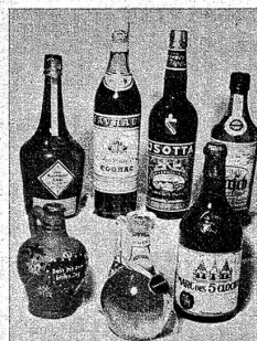
Drogerie Stauffer Bern, Schauplatzgasse 7