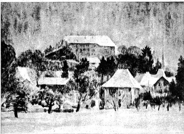
Laufen im Schnee von E. Ruprecht

«Du wirst ihn Meister Le Roux persönlich übergeben», befahl sie mir, «und auf Antwort warten.»