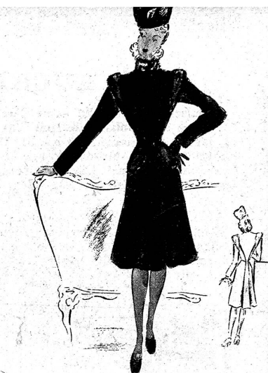
Sehr aparter Wintermantel mit Stickerei und Pelz garniert