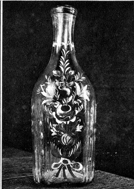
Bemalte Flüßlflasche, wie sie später hergestellt wurden