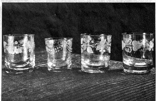
Geschliffene Gläser aus dem Emmental nach Art der Flüßlgläser, wahrscheinlich von wandernden Glasschleifern hergestellt