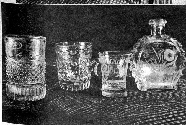
Ganz alte Flüßlgläser in Relief und geschliffen