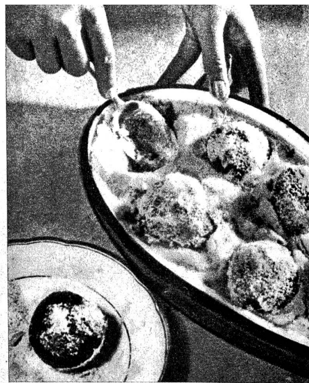
Gefüllte Tomaten in Kartoffelpurée

Die Kartoffeln werden gekocht, heiss durchgepresst, mit Salz und etwas Reibkäse gewürzt. Sind sie abgekühlt, so fügt man das Eiweiss bei und füllt die Masse in eine gefettete Backform. Die Tomaten übergiesst man mit heissem Wasser und zieht die Haut ab. Dann schneidet man je ein Deckelchen ab, holt die Tomaten aus. Das mit dem Eigelb, grünen Kräutern und Salz gemischte Fleisch füllt man in die Tomaten, legt den Deckel darauf und wälzt die Tomaten in Reibkäse. Dann drückt man sie in die Kartoffelmasse, streut den Rest des Käses darüber und backt zirka 15 Minuten bei Oberhitze.