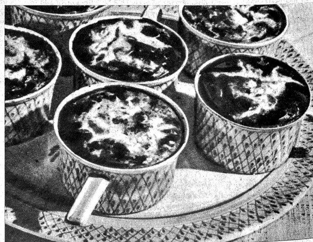
Restegericht in Förmchen