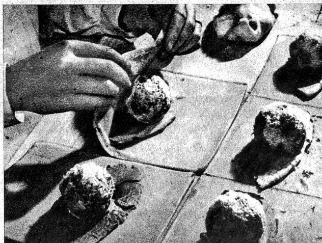
Tomaten in Mäntelchen

Man fettet kleine Backformen aus und legt in jede eine Schicht Reis, oder Gerste, oder Kartoffelstock. Darüber kommt eine Schicht Fleisch oder Fischreste und etwas Gemüse. Dann quirlt man für 3 Förmchen 1 Ei mit etwas Milch und Salz, giesst das über die eingeschichteten Reste, bestreut dick mit Reibkäse, legt, wenn möglich, ein Butterflöckchen obendrauf und überbäckt das ganze im Ofen.