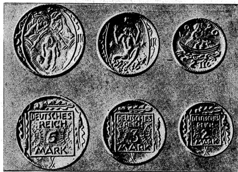
Deutsches Porzellantgeld, wie es an Stelle von Silbermünzen im Jahre 1920 hergestellt wurde