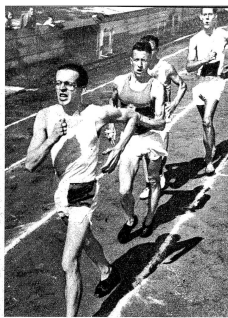
Die wenigsten würden sich bewusst sein, was es heisst, eine Grossveranstaltung wie die Juniorenmeisterschaften und den Leichtathletikwettkampf der Nationalmannschaften A und B in Bern auf eigenes Risiko zu unternehmen und damit auf eigenen Schultern einen Dienst an der Gemeinschaft zu leisten. Es geht nicht nur um Finanzziele, es geht um vieles mehr, um sportliche Ausbildung, gesundes Volk und hoffungsvolle Jungmannschaften. Die GGB hat es wieder einmal übernommen für eine Sache, die uns alle angeht, zu kämpfen und sie durchzuführen, und zwar in einer Weise, welche allgemeine Achtung und Anerkennung gefan-