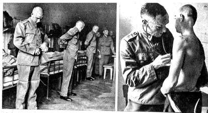
«Jede vor sie Nacht!» hat der Korporal gerufen und jetzt kontrolliert er die Hosenlängen, Schnalle mehr anziehen — Höher diese Hosen, und jene tiefer. Es ist alles nach sehr gabig am ersten Tag, die Rekruten und das viele Zeug aus Tuch und Leder, das sie fortan zu tragen und zu pflegen haben. Zens. Nr. 16381