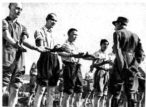
Wer in letzter Zeit schwer erkrankt war oder wer mit ansteckenden Krankheiten in Berührung kam, muss sich melden, wenn der Arzt seine Besichtigung macht. Zens. Nr. 16370