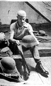
Mediation! Zens. Nr. 16373

Am frühen Nachmittag sind so ziemlich alle zivilen Aspekte vom Kasernenhof verschwunden. Die Neuingekleideten besinnen sich nochmals und werden nun in Kompanien und Züge eingeteilt. Zum erstenmal steht vor den Rekruten ihr Zugführer. Ein gegenseitiges Werweisen und Einschätzen hebt an. Prüfend überblickt der Leutnant seinen Zug, fragend hängen die Blicke der Rekruten am Leutnant. Scheuweis und ihre Wonne kaum verbergend, mit Notizbüchlein hantierend, murmeln die Korporale ihre Gruppen. Die Familien der Armee sind gebildet, der Weg ins militärische Leben nimmt seinen Anfang. Cfr. Th. F.