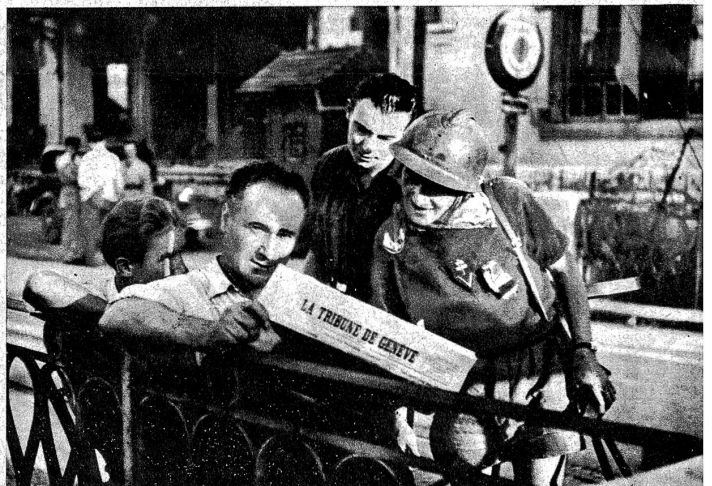
Oben: Die Schweizer Zeitungen sind sehr gefragt. Ein Maquis-Soldat mit Maschinenpistole verfolgt aufmerksam die Berichte aus Savoyen in einer Genfer Zeitung

Die Lage im Westen ist nach der «zweiten Landung» durchaus klar geworden. Das Ansetzen der «Landungszange» an zwei verschiedenen Stellen, mit dem Zwecke, eine Vereinigung zweier vorstossender Massen zustande zu bringen und so einen Teil Frankreichs abzuschneiden und die darin stehenden Deutschen «auszumanövrieren», ist in viel grösserem Maßstabe durchgeführt worden, als man