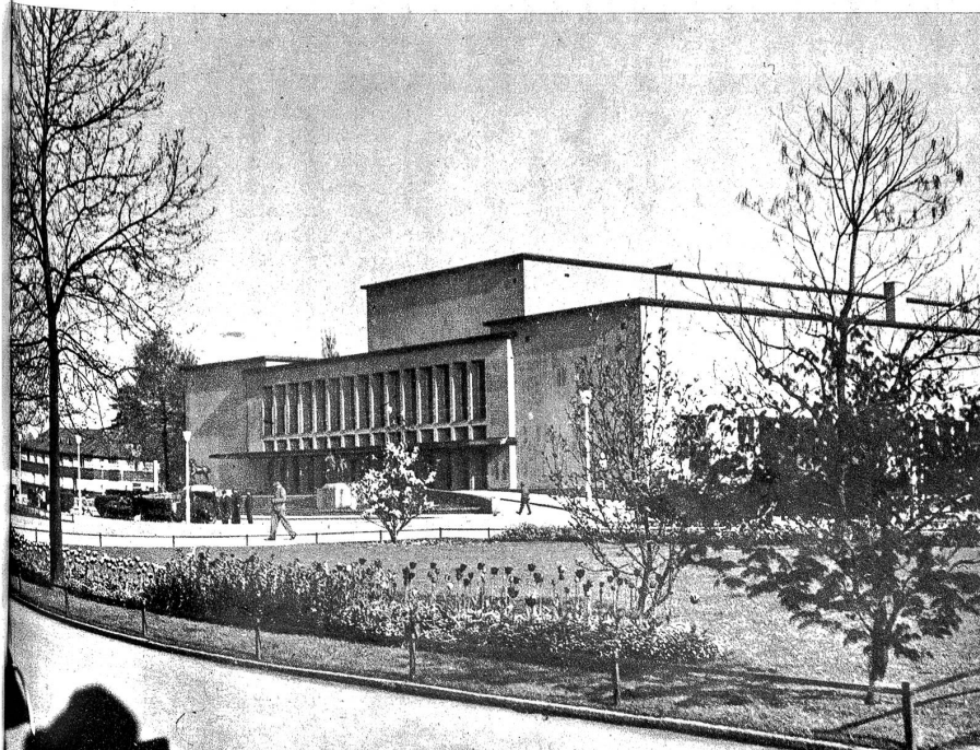
Das Kunsthaus in Luzern, in welchem die Konzerte und die Ausstellung des Kunstmuseums stattfinden