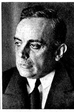
Dr. Volkmar Andreae