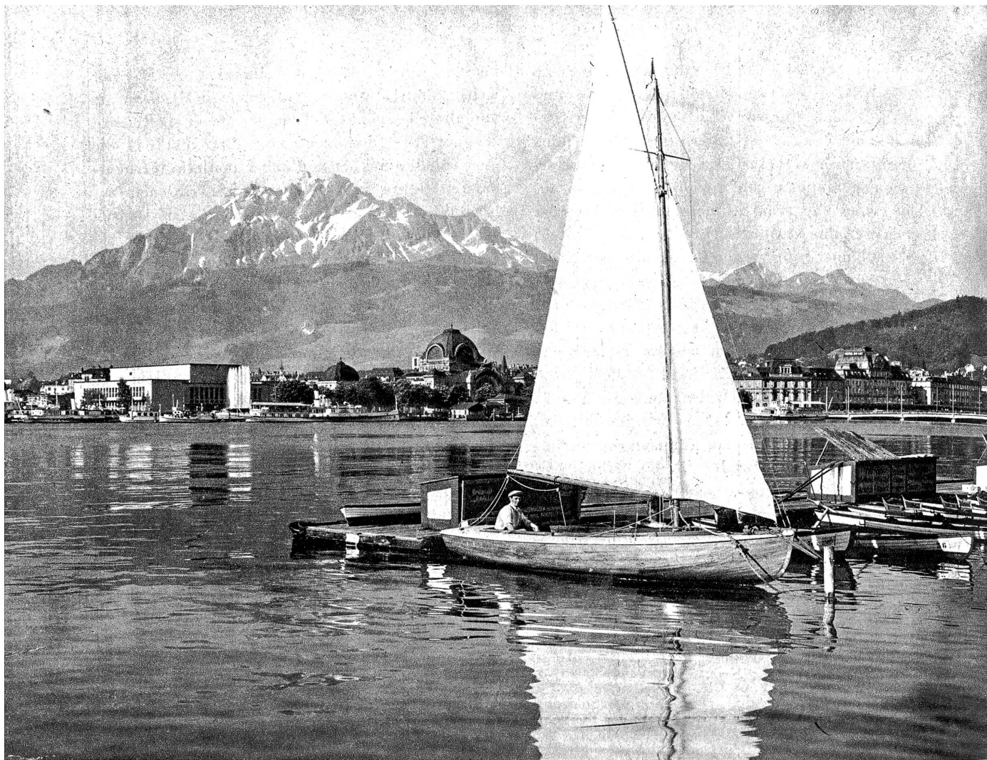
Luzern, im Hintergrund der Pilatus (Zens. Nr. 7473)