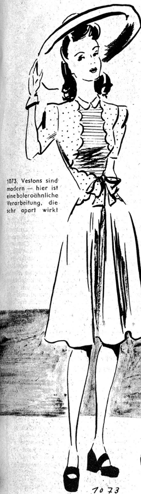
1073. Vestons sind modern — hier ist eine boleroähnliche Verarbeitung, die sehr apart wirkt