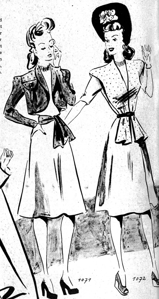
1071. Ein Bolero aus bedruckter Seide und ein gleicher Gürtel dazu geben dem alten Kleid ein ganz neues Aussehen