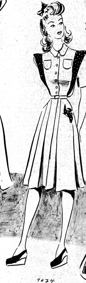
1074. Ganz neu wirkt das alte Sportkleidchen mit der schulterverbreiternden Garnitur