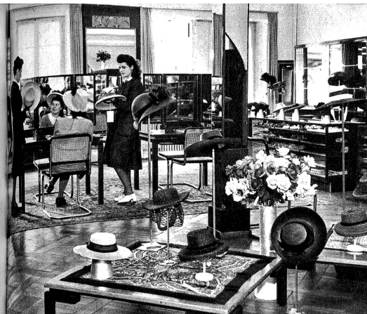
Die Modeabteilung — Rayon mode