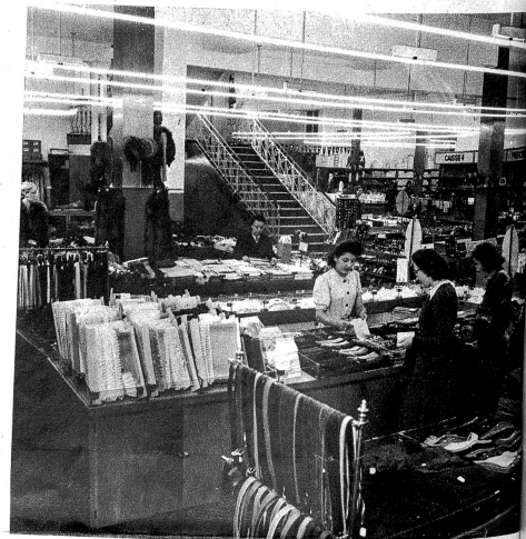
Teilansicht des Verkaufsraumes im Parterre — Vue partielle du parterre