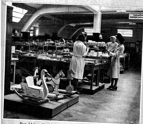
Das kleine Kinderparadies — Le paradis des enfants Unten: Weisswaren und Schürzen — Ci-dessous: Tabliers et trousseaux