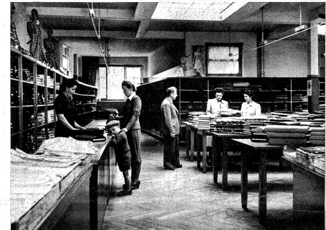
Die Beleuchtung der Stoffabteilung ist auf eine originelle Art durchgeführt — L'éclairage du rayon tissu est conçu d'une manière originale

L'agrandissement d'une entreprise n'exige pas seulement de l'espace, mais une certaine stabilité financière. Pour cela il est nécessaire de procéder à des achats en commun avec d'autres grands magasins suisses. C'est ainsi que la maison acquit toute son importance dans la région et devint la plus grande entreprise du genre à Bienne. La direction a su perfectionner son organisation durant ces dernières années de telle manière que les diverses parties de l'entreprise se complètent et fonctionnent comme les rouages d'une montre. Les vitrines furent évidemment aussi transformées et agrandies dans le cadre de cette nouvelle organisation. Une installation électrique spéciale dans tous les rayons permet à l'œil de choisir sûrement et sans fatigue.