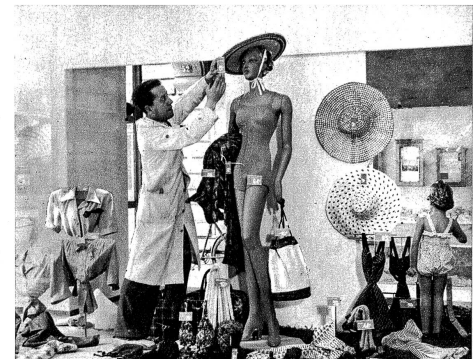
Das Schaufenster ist der wichtigste Verkäufer und zugleich das Aushängeschild des Geschäftes La vitrine est de grande importance et constitue le visage de la vente