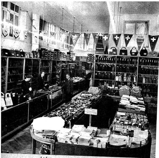
Lederwaren — Rayon maroquinerie