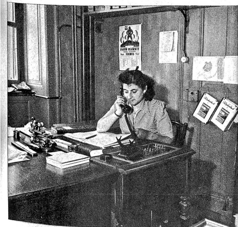
Eine wichtige Person — Das Telefonfräulein Une personne importante: la téléphoniste Rechts: Ansicht des Verkaufsraumes im Parterre A droite: Vue des locaux de vente au parterre

La première guerre mondiale eut aussi ses répercussions sur le développement du magasin. Elle eut pour effet de modérer son essor. Les temps difficiles se firent sentir comme dans l'économie générale. Après la fin de la guerre, la lutte reprit avec tous ses espoirs. Le premier magasin de la rue Basse fut liquidé pour faire place au nouveau commerce de la rue de Nidau n° 31.