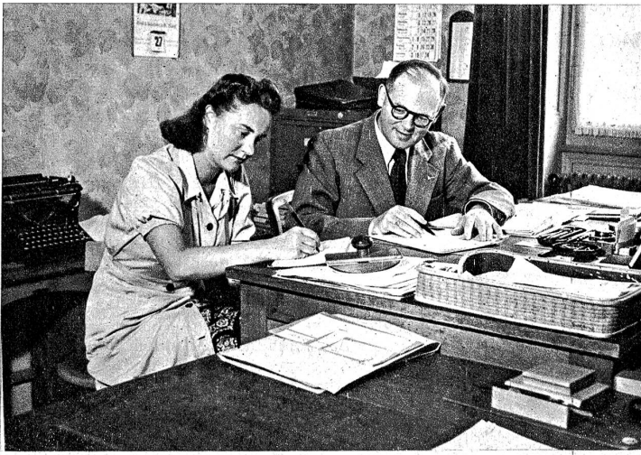
Buchhaltung und Sekretariat — Comptabilité et secrétariat