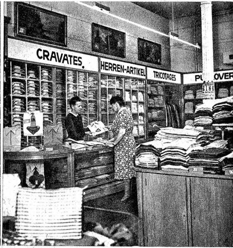
Herrenartikel — Département articles pour messieurs