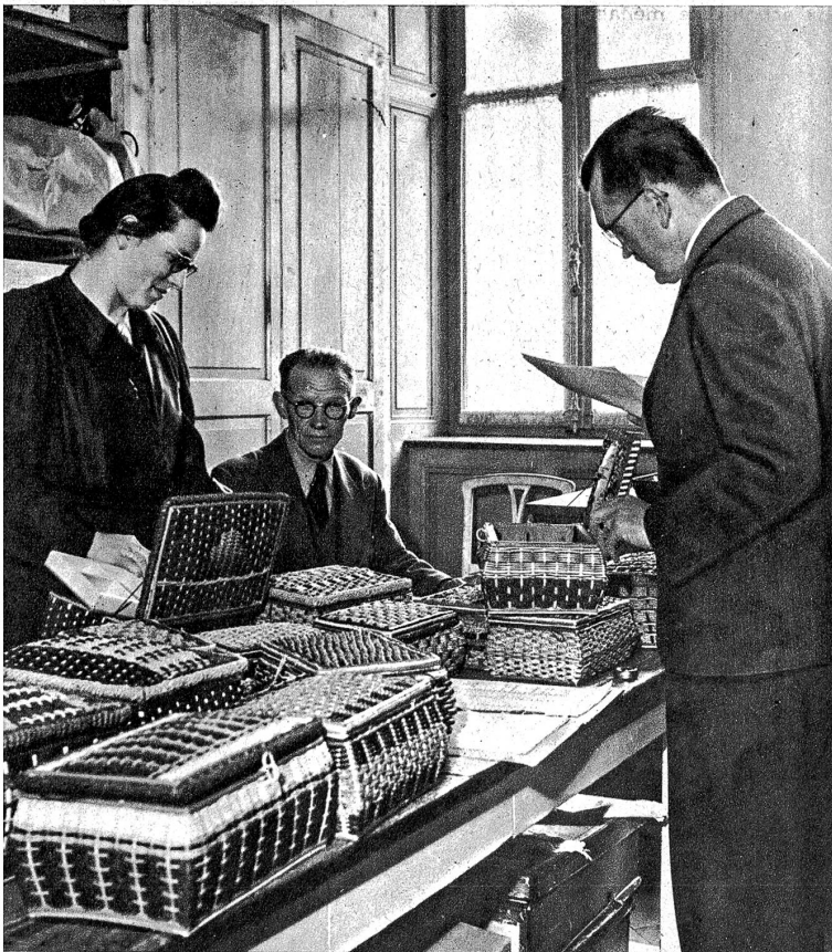
Abteilung für den Einkauf — Département d'achat