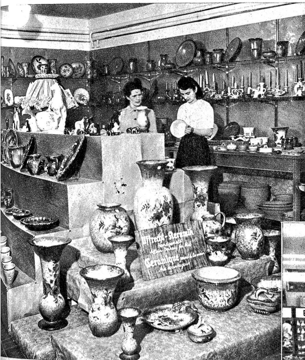
Abteilung Keramik — Département céramique