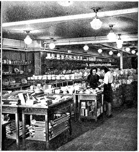
Porzellan — Porcelaine