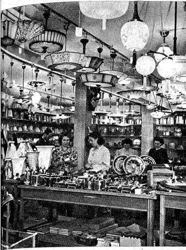
Elektrizität — Département électricité