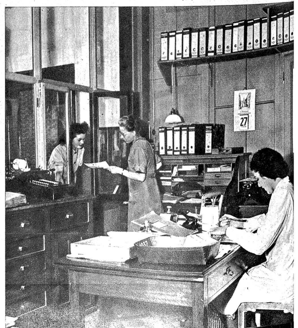
Abteilung für Eingänge und Empfang — Département de réception