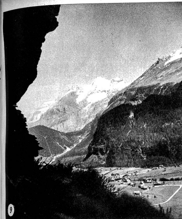
9 Was ist das für ein Tal und wie heisst der Berg im Hintergrund?