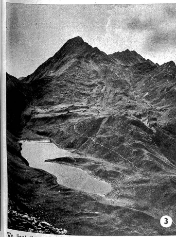
3 Wo liegt dieser kleine Bergsee und wie heisst der Berg im Hintergrund? Beh. bew. Nr. 7473 BRB. 3. 10. 39.