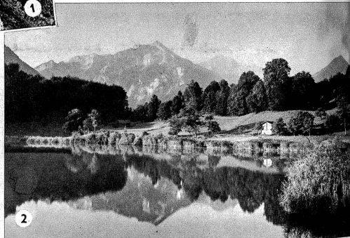
2 Wo liegt dieser schöne idyllische See und wie heissen die Berge im Hintergrund? Beh. bew. Nr. 1501 BRB. 3. 10. 39.