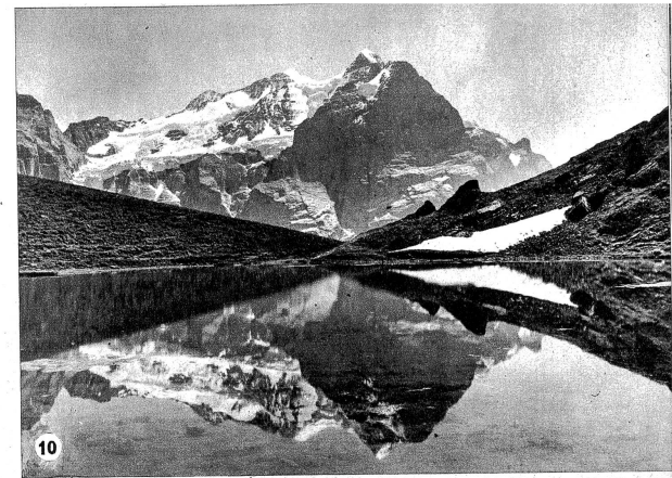
10 Wo liegt dieser See und was ist das für ein Berg im Hintergrund Beh. bew. 28. 1. 44. BRB. 3. 10. 39.