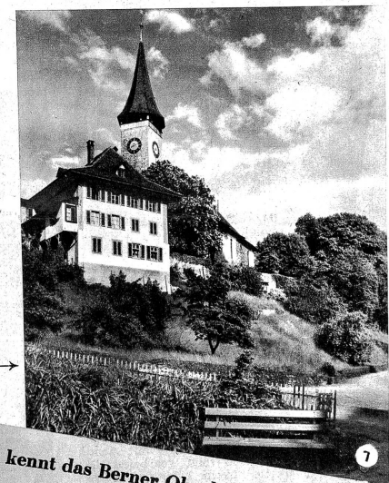
7 Wo steht diese Kirche → und das Pfarrhaus daneben?