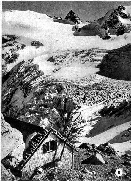
8 Wie heisst dieser Gletscher und was ist das für eine Klubbhütte im Vordergrund?