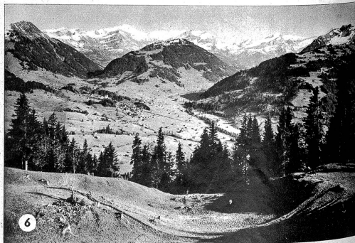
6 Wie heisst der Ort im Hintergrund und in welcher Gegend liegt er? Beh. bew. 18. 6. 1940 BRB. 3. 10. 39.