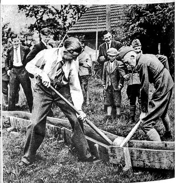
Nachmittags beginnen die verschiedenartigsten Spiele