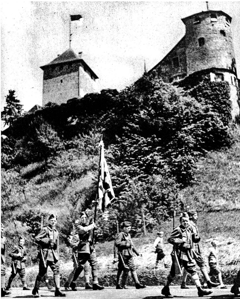
5 Uhr früh ist Tagwache: Kanonenschüsse begrüssen den neuen fest- lichen Tag. Nachmittags wird die Kanonade wiederholt

Das Jugendfest in Murten, Solennität ge- heissen, wird seit vielen Jahren immer am 22. Juni gefeiert, in Erinnerung an die Schlacht bei Murten. Mehrere Tage vorher gehen die Kinder mit Wägelchen und Kör- ben in den Wald, um Moos zum Schmuck der Brunnen im Städtchen zu holen, und die Mäd- chen winden Kränze zum Schmuck fürs Fest. Jedes Kind sieht sich rechtzeitig im eigenen Garten oder bei Freunden und Verwandten nach Blumen um. Morgens 5 Uhr ist Tag- wache. Eine Kanonade donnert vom Schul- haus her und die Musik und die Tambouren