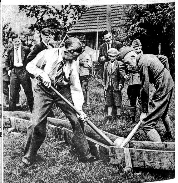
Nachmittags beginnen die verschiedenartigsten Spiele