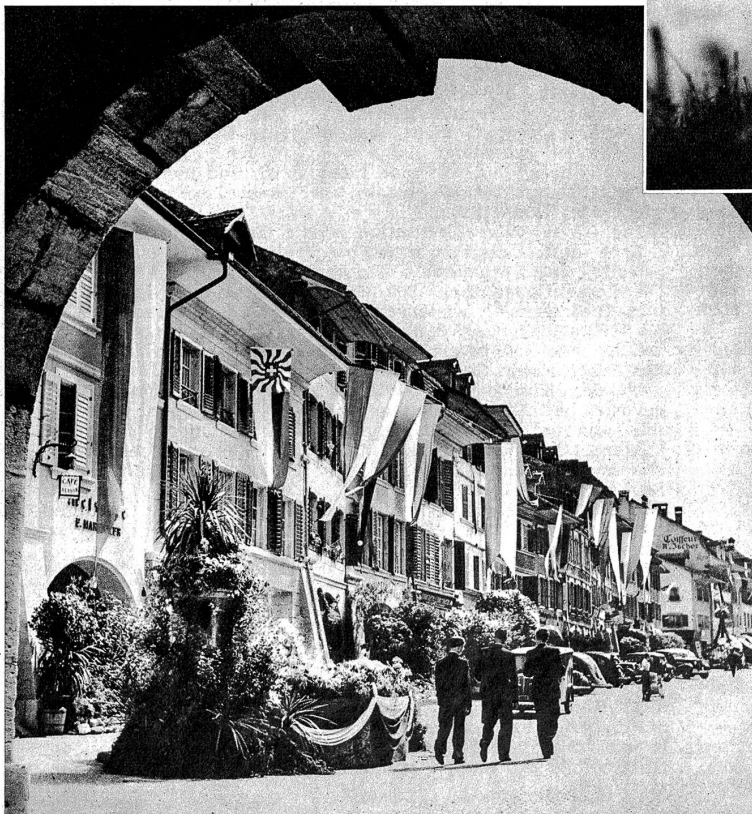
Das Städtchen Murten liegt in prächtigem Festschmuck, die Brunnen sind mit Moos und Blumen bekränzt. Das Moos wurde einige Tage vor dem Fest von der Schul- jugend im Wald gesammelt