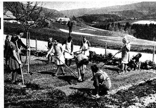
Die Schulgartenarbeit wird stets mit grosser Freude besorgt Zens.-Nr. BRB 3. 10. 39.

Nachsatz: Unser Bericht enthält ein schönes Beispiel praktischer Berghilfe, wie sie von der gleichnamigen Aktion