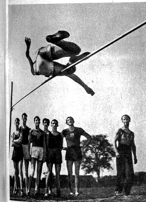
Links: Ein Berner Nachwuchsspringer demonstriert unter dem gespannten Blick seiner Kameraden aus allen Landesteilen die amerikanische Rollertechnik

Antwort: Die «Borussen» oder «Prußen», wie sie von den Polen und Tschechen genannt wurden, gehören dem lettisch-litauischen Sprachstamm an. Sie besetzten nach der Völkerwanderung alle Küstengebiete bis in die Gegend von Danzig und Thorn. Um sich ihrer zu erwehren, rief der polnische Teilfürst von Masowien (Masuren) die Deutschritter ins Land, die damit die Vernichtung der elf borussischen Stämme einleiteten. Der Rest der Borussen oder «echten alten Preussen» wird heute zu den Litauern im Memelland gerechnet. Zahlreiche Ortsnamen erinnern noch an sie. Man suche etwa auf der Karte «Stallupönen» oder «Gumbinnen».