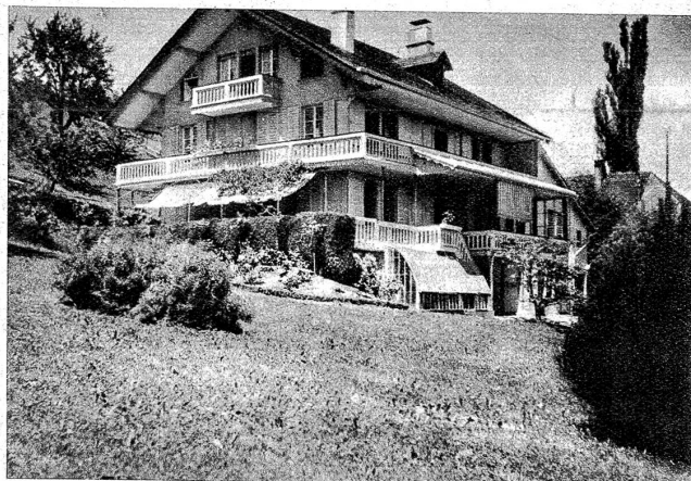
Das Heim des Künstlers in Gerzensee