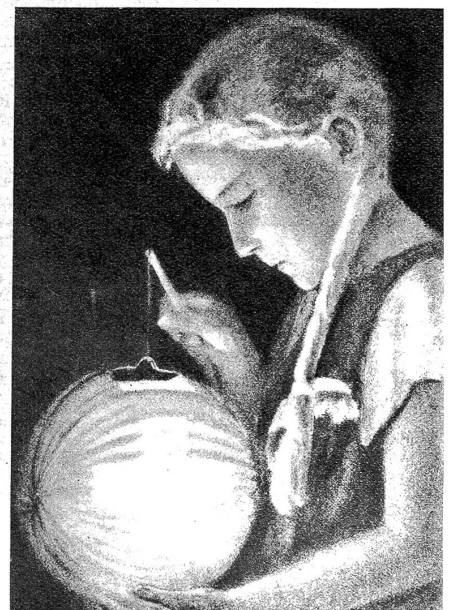
Mädchen mit Lampion