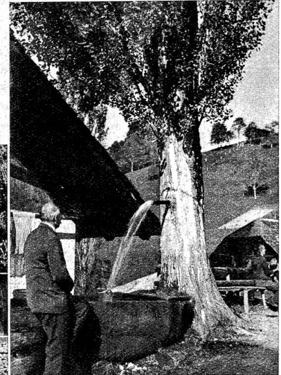
Unten: Baumbrunnen in Merligen

Nicht nur an der Sigriswilerstrasse in Gunten auch oben in Endorf gibt es einen Baumbrunnen. Man hat in eine junge Pappel (Saarbaum) — nicht in eine Linde, wie kürzlich in verschiedenen Blättern zu lesen war — eine Rinne ausgehöhlt und darin die aufsteigende Wasserröhre befestigt. Im Laufe der Jahre haben Holz und Rinde das Eisen überwallt und unsichtbar gemacht. So scheint es, als ströme das kostbare Element direkt aus dem Baumstamm. — In Gunten hat man den Stamm der Pappel vor dem Pflanzen von den Wurzeln bis zum Auslauf direkt durchbohrt. — Ein anderer Baumbrunnen befindet sich in Merligen. Mögen die interessanten Bäume vor Blitzschlag und andern Gefahren verschont bleiben.