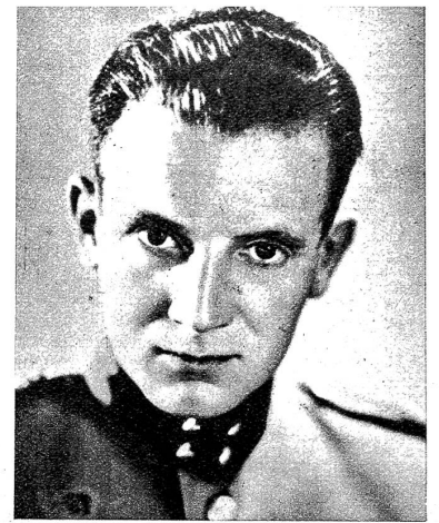
Hauptmann Fritz Burkhalter, der Stellvertreter des schweizerischen Militärattachés in Rom, wurde bei einem Luftangriff auf Bologna durch einen Granatsplitter getötet. Der im Dienst fürs Vaterland gefallene Offizier stammt aus Langenthal