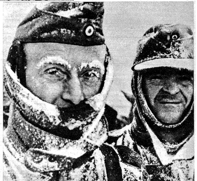
Deutsche Soldatentypen im russischen Winter an der Nordfront