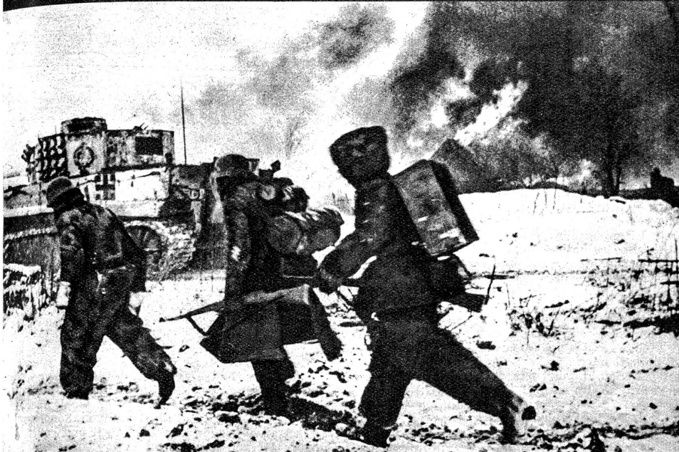
In Panzerdeckung gehen deutsche Grenadiere an einem in Brand geschossenen Dorf an der russischen Südfront vorbei zurück