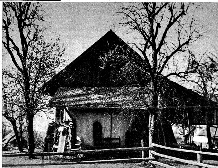
Unter dem Vordach befindet sich der nach Osten gerundete Chor