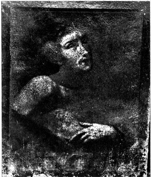
In Auression im Onsernone-Tal (Kt. Tessin), ist ein Gemälde entdeckt worden, das man Michelangelo zuschreibt. Es soll sich um ein Teilstück des Werkes „Il Riscatto“ handeln, das Michelangelo im Jahre 1522 schuf und das bei einem Brand in Turin im Krieg 1770—80 zum Teil zerstört wurde.

Diesen Hinweisen wurde schon vor Jahresfrist entgegengehalten, falls ein russischer Sieg über die deutschen Invasionsarmeen in der Zukunft möglich sein würde, müssten die letzten Phasen des Krieges ungefähr die Umkehrung der ersten darstellen. Das heisst also, dass den Russen alsdann zuerst kleinere, dann grössere Einkesse-