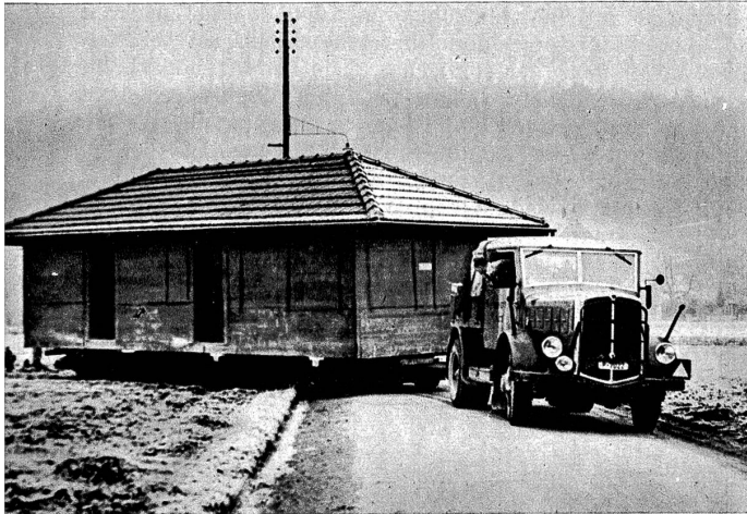
Wenn der Baumeister die Scholle betritt, so muss der Pflanze weichen. Aus diesem Grunde wurde letzte Woche das 10 m lange Pflanzhaus der Firma Dr. Wander AG. vom Liebfeld nach dem neuen Areal im Steinhölzli transportiert

lungen gelingen könnten. Dass sie zunächst lokale, dann weiter führende Durchbrüche erzwingen und mit dem Sinken der Waage zu ihren Gunsten auch grössere und zuletzt ähnlich grosse Gefangenmassen einbringen müssten. Und wenn die ersten Wochen des deutschen Angriffes im Blitztempo vor sich gingen, würden die Russen in den letzten dieses Tempo erreichen. Das sind nicht einfach «Prophezeiungen», sondern Ergebnisse logischer Ueberlegungen.