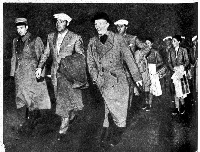
Ankunft der Schweizermannschaft für den Skiwettkampf Schweden-Schweiz in Stockholm, wo sie begeistert empfangen wurde.

Als dann am 4. Februar die Siegesmeldung aus Moskau kam, war die entscheidende Aktion der beiden russischen Armeen schon gelungen. Das heisst: Watutins Ostflügel hatte die ganze Westflanke eingedrückt und zugleich den Raum bis südlich von Swenigorodka erobert. Konjews Nordflügel war auf der ganzen «Ingulfront» im Nordwesten von Kirowograd bis nördlich von Smjela über die östliche Flankensicherung vorgebrochen und erkämpfte nördlich von Schpol die Verbindung mit Watutin. Das eingekreiste Gebiet umfasste ein Viereck von mehr als 30 km Seitenlänge. Dem russischen Ansturm fielen Mironowka, Boguslaw und Kanjew im Westen, Zwethkowo ,