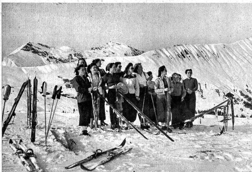
Auf der Mülkerplatte