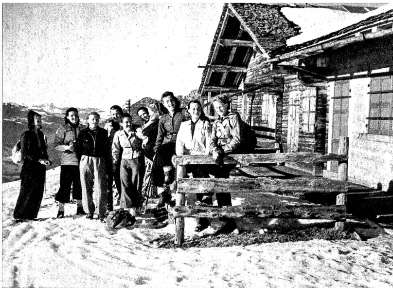
Frohe Rast auf der Abfahrt