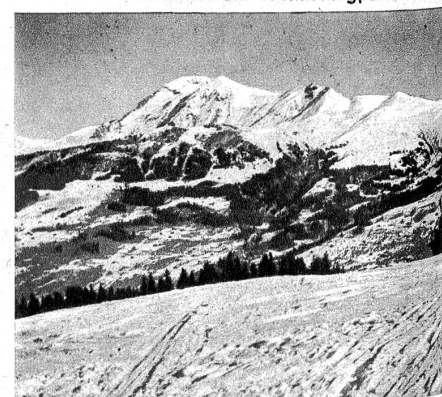
Albristhorn und Laveygrat