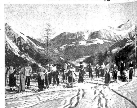
Rechts: Im Aufstieg zum Betelberg