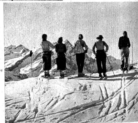
Aussicht vom Truttlisbergpass

Es ist ebenso selbstverständlich, dass einer der Grundsätze, die für die Durchführung eines Skilagerns massgebend sind, der möglicher Einfachheit ist. Auch in oberen Mittelschulen, besonders aber in städtischen Primarschulen, muss Rücksicht