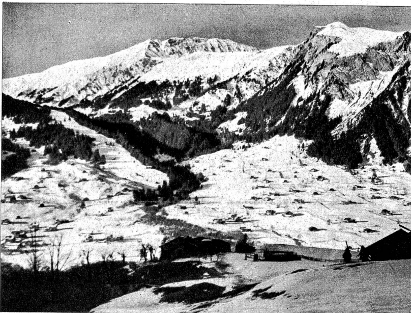
Winterlandschaft bei Lenk