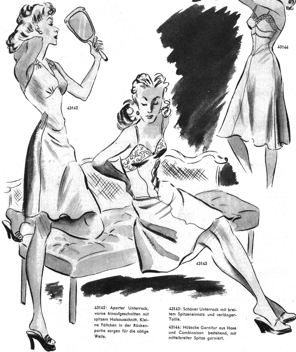
43142: Aparter Unterrock, vorne hinaufgeschnitten mit spitzem Halsausschnitt. Kleine Fältchen in der Rückenpartie sorgen für die nötige Weite.