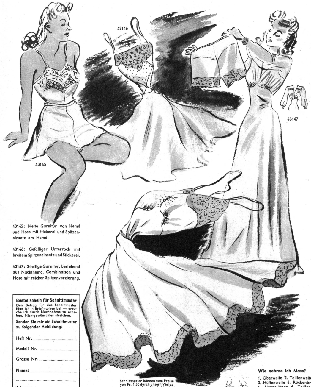
43145: Nette Garnitur von Hemd und Hose mit Stickerei und Spitzeneinsatz am Hemd.