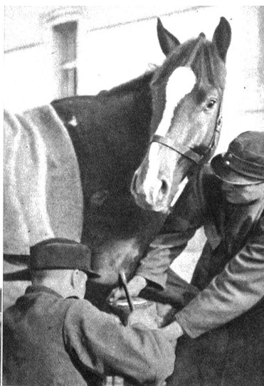
Oben: Nachdem das Hufeisen gut angepasst ist, wird es mit sieben bis acht Nägeln auf der Hornkapsel befestigt, ohne dass der „lebende“ Teil des Hufes berührt werden darf. Der „Bless“ selbst schaut der Arbeit neugierig zu