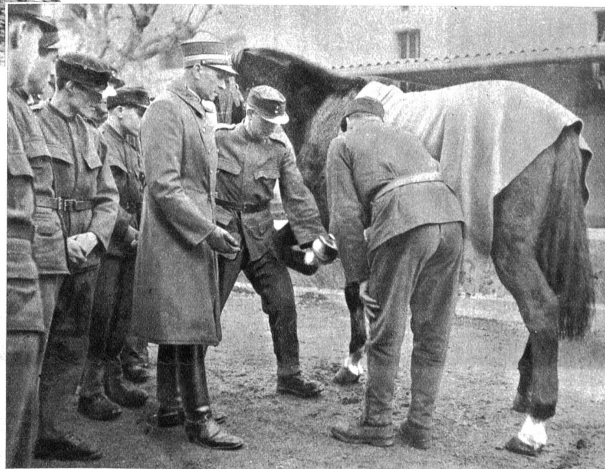
Oben links: Nun kommt das erste Eisen auf den lebenden Pferdehuf, nachdem es für die entsprechende „Schuhnummer“ zugerichtet wurde