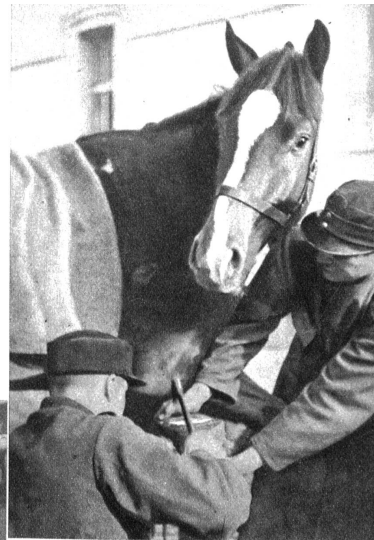
Oben: Nachdem das Hufeisen gut angepasst ist, wird es mit sieben bis acht Nägeln auf der Hornkapsel befestigt, ohne dass der „lebende“ Teil des Hufes berührt werden darf. Der „Bless“ selbst schaut der Arbeit neugierig zu