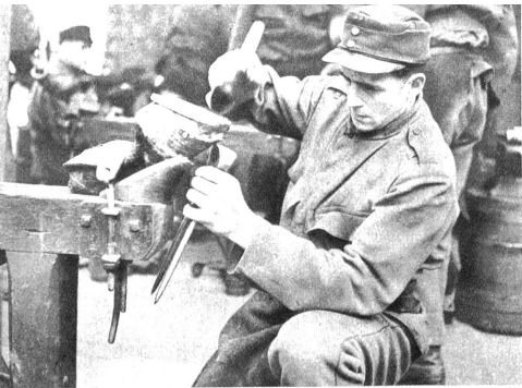
Viele Hammerschläge und manchen Schweisstropfen braucht es, bis ein Hufeisen vollendet ist. Unter Kontrolle wird das Eisen auf den „toten“ Huf genagelt