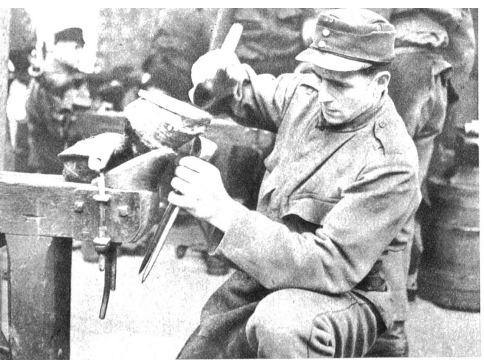
Viele Hammerschläge und manchen Schweisstropfen braucht es, bis ein Hufeisen vollendet ist. Unter Kontrolle wird das Eisen auf den „fotnen“ Huf genagelt