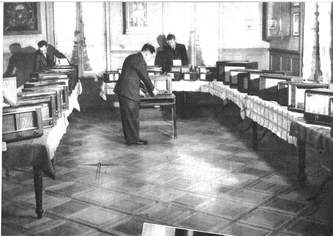
Ansicht der Ausstellung in Gümligen

Man muss sich zu helfen wissen, lautet eine einfache Regel, nur sagt gewöhnlich eine solche Regel nicht deutlich, wie man sich behelfen soll, wenn die Zeiten, wie die unsrigen, Sorgen auf Sorgen an den Mann häufen.