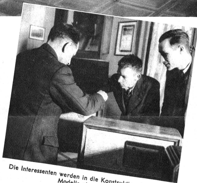
Die Interessenten werden in die Konstruktion der neuen Modelle eingeweiht

Das Handwerk und besonders das Radiohandwerk und der Radiohandel haben es gewiss nicht leicht, sich klar durchzusetzen. Um so bemerkenswerter ist es, wenn man plötzlich einer Radioausstellung begegnet, die ihren Standort zeitweise wechselt. Der Interessent vom Lande hat den Vorteil, mit neuesten Modellen bekannt zu werden, auch steht ihm die Möglichkeit zu, in einem Zeitpunkt, wo er seine Freizeit genießen kann, sich in alle Geheimnisse dieser modernen Errungenschaft einweihen zu lassen. Von seinesgleichen wird er mit der Manipulation vertraut gemacht und ausserdem kann er an Ort und Stelle dasjenige Modell für sich auswählen, welches für seine Verhältnisse am geeignetsten erscheint. So hat eine gute Idee — ein Radio geht auf die Reise — ihre gesunden Früchte gezeitigt.