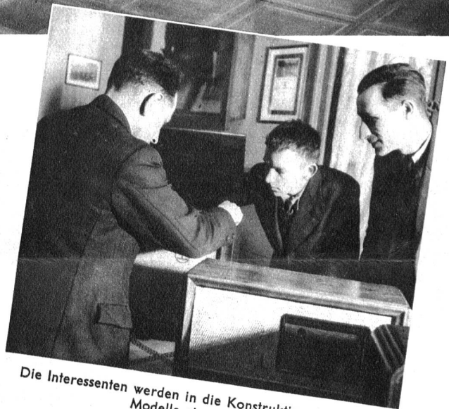
Die Interessenten werden in die Konstruktion der neuen Modelle eingeweiht

Das Handwerk und besonders das Radiohandwerk und der Radiohandel haben es gewiss nicht leicht, sich klar durchzusetzen. Um so bemerkenswerter ist es, wenn man plötzlich einer Radioausstellung begegnet, die ihren Standort zeitweise wechselt. Der Interessent vom Lande hat den Vorteil, mit neuesten Modellen bekannt zu werden, auch steht ihm die Möglichkeit zu, in einem Zeitpunkt, wo er seine Freizeit genießen kann, sich in alle Geheimnisse dieser modernen Errungenschaft einweihen zu lassen. Von seinesgleichen wird er mit der Manipulation vertraut gemacht und ausserdem kann er an Ort und Stelle dasjenige Modell für sich auswählen, welches für seine Verhältnisse am geeignetsten erscheint. So hat eine gute Idee — ein Radio geht auf die Reise — ihre gesunden Früchte gezeitigt.