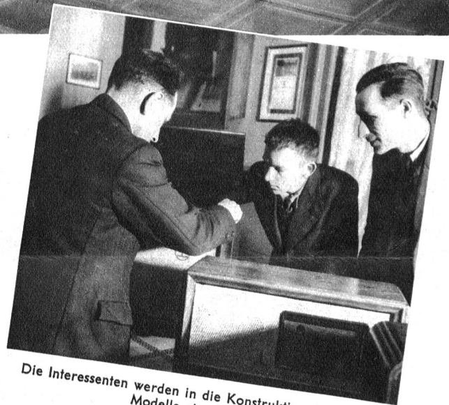
Die Interessenten werden in die Konstruktion der neuen Modelle eingeweiht

Das Handwerk und besonders das Radiohandwerk und der Radiohandel haben es gewiss nicht leicht, sich klar durchzusetzen. Um so bemerkenswerter ist es, wenn man plötzlich einer Radioausstellung begegnet, die ihren Standort zeitweise wechselt. Der Interessent vom Lande hat den Vorteil, mit neuesten Modellen bekannt zu werden, auch steht ihm die Möglichkeit zu, in einem Zeitpunkt, wo er seine Freizeit genießen kann, sich in alle Geheimnisse dieser modernen Errungenschaft einweihen zu lassen. Von seinesgleichen wird er mit der Manipulation vertraut gemacht und ausserdem kann er an Ort und Stelle dasjenige Modell für sich auswählen, welches für seine Verhältnisse am geeignetsten erscheint. So hat eine gute Idee — ein Radio geht auf die Reise — ihre gesunden Früchte gezeitigt.